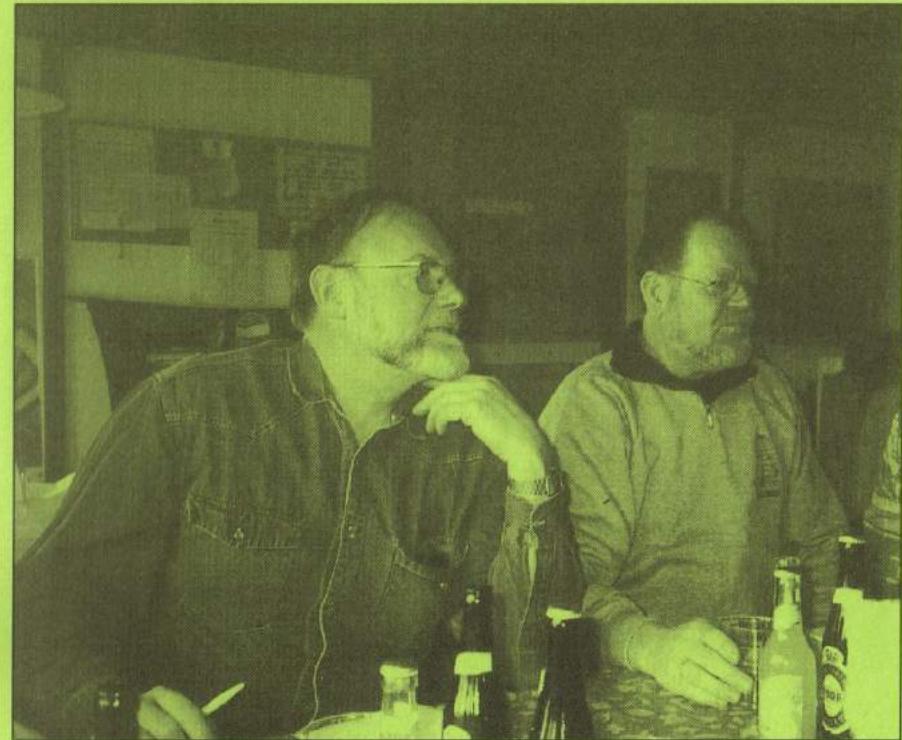
Generalforsamling i Korsør 1999